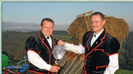
Jodlerduett 5 vor Zwöufi, 13. Februar 2020