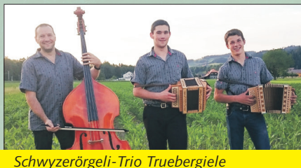
Schwyzerörgeli-Trio Truebergiele 8. Februar 2020