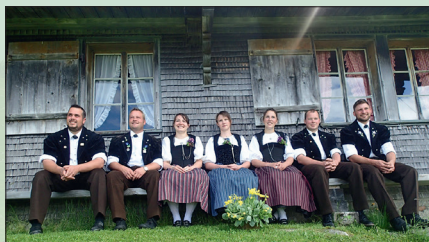
Jodlerchörli nie Zyt, 8. Februar 2020