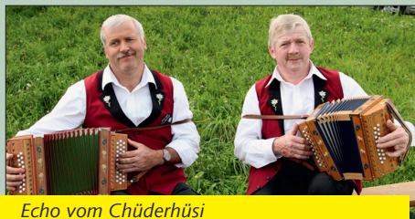
Echo vom Chüderhüsi 15. Februar 2020