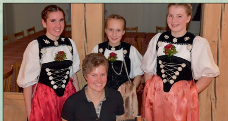
Terzett MeRoDe, 15. Februar 2020