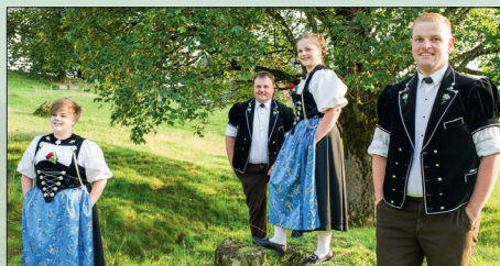
Spycherlijodler Eggiwil, 9. Februar 2020